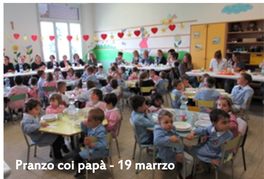
Pranzo coi papà - 19 marzo